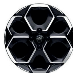
Hliníkový disk ATACAMITE 17" s výbrusem