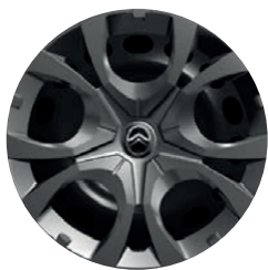
Okrasný kryt PYRITE 16"