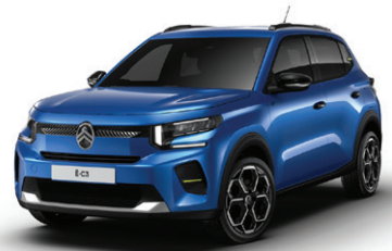
Modrá BRIGHT (M)