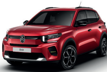
Červená ELIXIR (M)