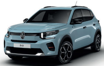
Modrá MONTE CARLO