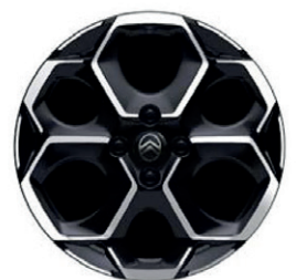
Hliníkový disk ATACAMITE 17" - diamantée