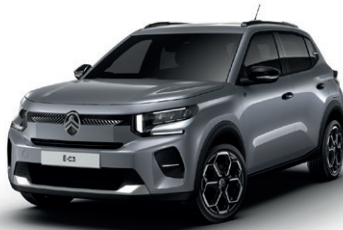
Šedá MERCURY (M)