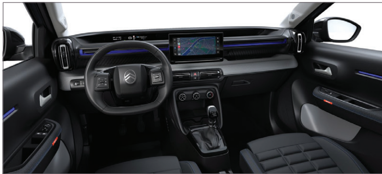
PLUS: LÁTKA ČERNÁ FABRIC / ŠEDÁ SERGE FABRIC