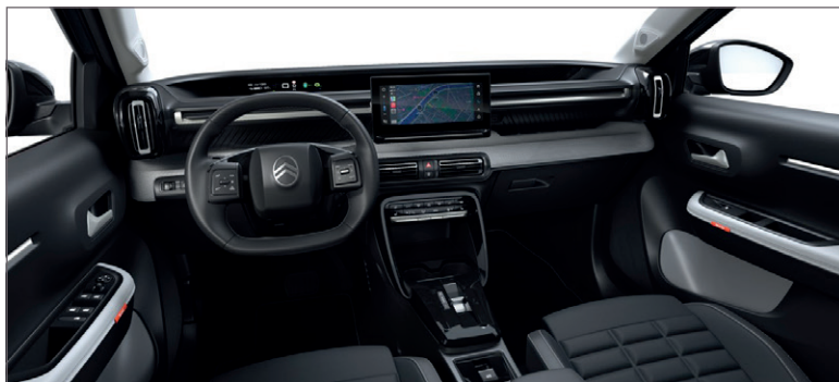
MAX: LÁTKA ČERNÁ FABRIC / ŠEDÁ KOŽENKA