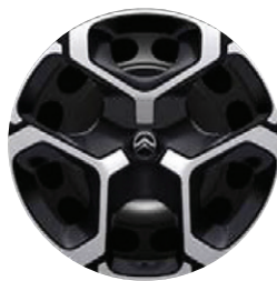
Okrasný kryt AZURITE 17"