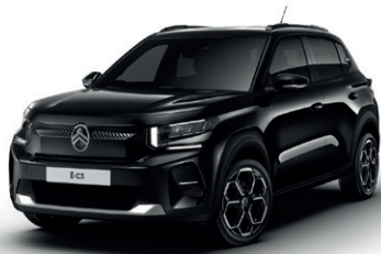
Černá PERLA NERA (M)