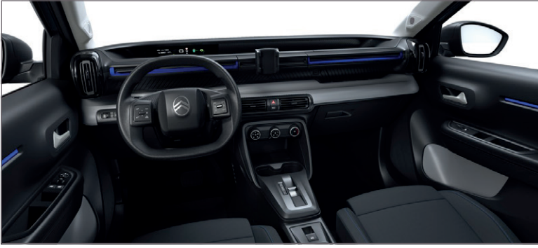
YOU: LÁTKA ČERNÁ FABRIC / ŠEDÁ FABRIC