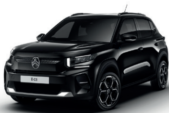
Černá PERLA NERA (M)