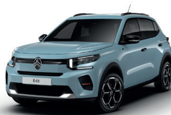
Modrá MONTE CARLO