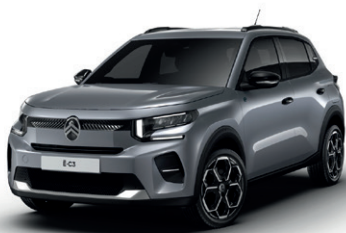
Šedá MERCURY (M)