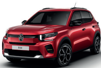
Červená ELIXIR (M)