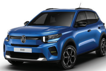
Modrá BRIGHT (M)