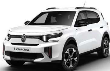
Bílá BANQUISE (N)