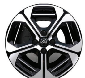
Hliníkový disk ARAGONITE 17" – s výbrusem