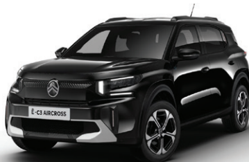
Černá PERLA NERA (M)