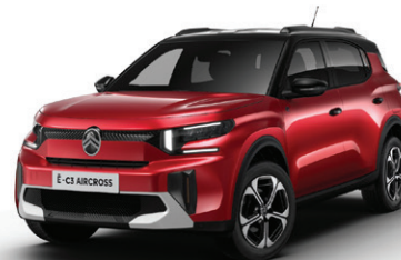
Červená ELIXIR (M)