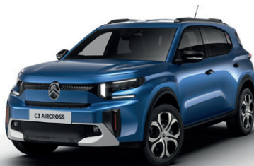
Modrá BRIGHT (M)