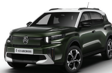
Zelená MONTANA (M)