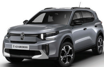
Šedá MERCURY (M)