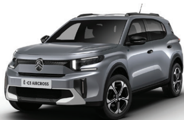
Šedá MERCURY (M)