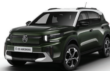
Zelená MONTANA (M)