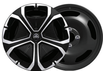
Okrasný kryt TITANITE 16"