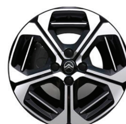
Hliníkový disk ARAGONITE 17" – s výbrusem