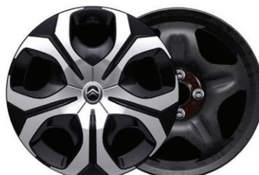
Okrasný kryt SYLVANITE 17"